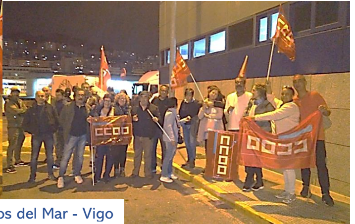
Pereira Productos del Mar - Vigo