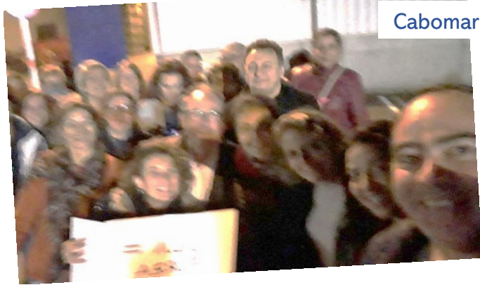
Cabomar - Pontevedra