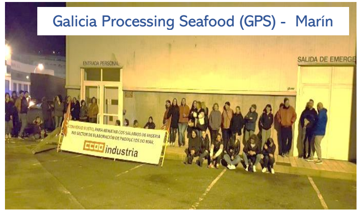
Galicia Processing Seafood (GPS) - Marín