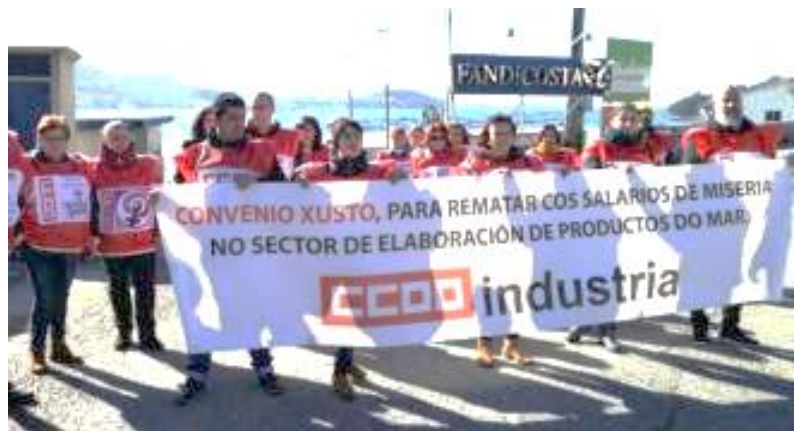
Protesta frente a Fandicosta CCOO

Para los sindicatos el convenio estatal de elaborados de productos del mar debe caminar hacia los 14.000 euros anuales de salario base hasta 2020. A día de hoy, y sin el complemento de convenio, el sueldo base ronda los 715 euros mensuales . Las centrales reclaman también la reducción de jornada anual en 16 horas, lo que supondría calificar como no laborables los días 24 y 31 de diciembre.