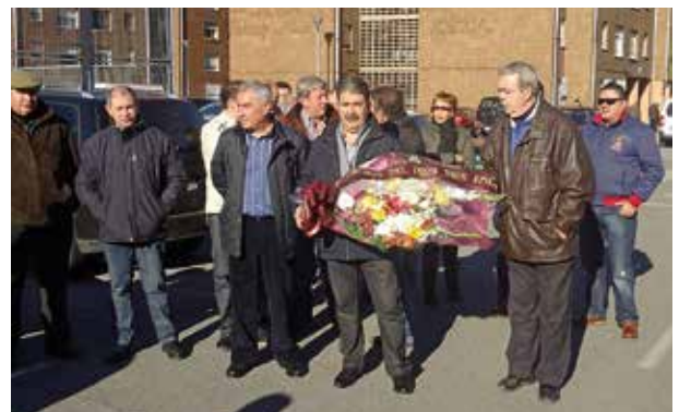
Ofrenda floral a las víctimas de la minería.

Los mineros y las Cuencas siempre han hecho piña en momentos difíciles, conscientes de que la dureza del trabajo hay que hacerla más llevadera combinándola con alegría y fiesta. Por ello el día 4 de diciembre todos se vuelcan en los actos en honor a Santa Bárbara, patrona y protectora, una tradición que gracias a la voluntad de grupos de compañeros y amigos como la Hermandad de Santa Bárbara de Mieres, no han caído en el olvido. Compañerismo, amistad, recuerdos y anécdotas en una jornada para la memoria. Para completar los eventos, el 4 de diciembre un grupo de unos 100 mineros del Pozo Tres Amigos, participó en la ofrenda floral a las víctimas de la minería que se realizó frente al mítico monumento al Minero, aquel que se erigió como homenaje a raíz del fatídico accidente del 31 de agosto de 1995, cuando perdieron la vida 14 trabajadores en el pozo San Nicolás.