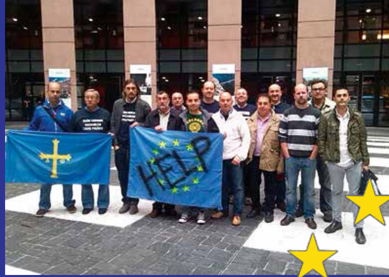
El Comité durante el viaje a Bruselas.

El viaje a Bruselas de los representantes de la plantilla logró recabar importantes apoyos comunitarios. El día 8 fueron recibidos por Antonio Tajani, vicepresidente de la Comisión Europea y responsable de industria, quien se comprometió a revisar las ayudas concedidas a la multinacional desde instancias europeas y pedir información a la empresa.