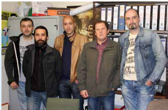
Sección Sindical de CCOO en MRT. En las recientes elecciones sindicales, CCOO logra cinco de los nueve delegados del Comité.

Después de que los trabajadores, junto con la Sección Sindical en MRT y la Federación de Industria de CCOO de Asturias, consiguiesen frenar las pretensiones de descuelgue de convenio que planteaba la empresa, la dirección vuelve a intentar limar derechos mediante el chantaje a la plantilla. El vuelco en los resultados en las recientes elecciones sindicales es un claro respaldo a la gestión de los delegados de CCOO, al otorgarles la mayoría en el nuevo Comité.