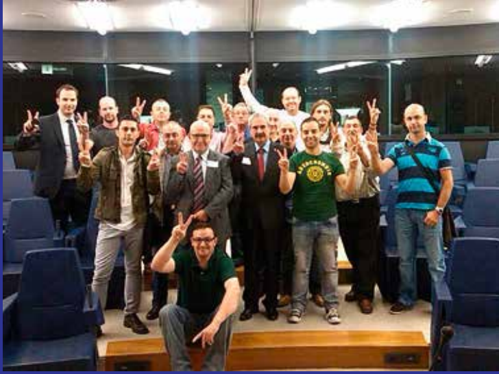
Con el Comisario de Industria de la UE , Antonio Tajani.