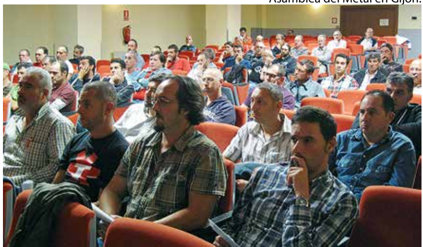
Asamblea del Metal en Gijón.

diendo siempre la negociación colectiva como forma de llegar a acuerdos. Pero la cerrazón de Femetal y la progresiva radicalización de su postura nos condujo finalmente a la convocatoria de nueve días de huelga en todo el sector a partir del 29 de octubre para desbloquear la negociación. La contundencia de la respuesta logró que la patronal reconsiderase sus planteamientos y decidiese asumir propuestas más acordes con la situación real del sector. El mismo día 29 se alcanzó un preacuerdo que fue some-