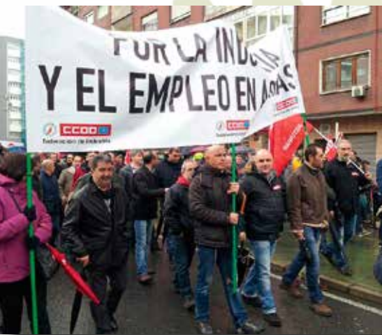
Miles de personas se manifestaron en Avilés en rechazo a las políticas del Gobierno, el 24 de noviembre.

que nos debe dar ánimos de cara a afrontar los próximos años, y es además una deuda que teníamos pendiente con nuestros afiliados y con los trabajadores de la industria en general. Nuestro objetivo con ello es hacer frente de una manera más eficaz a las necesidades de todos los afiliados y al cumplimiento de las metas que nos hemos marcado. Es una organización con la que compartimos, primero, los valores que nos hacen pertenecer a CCOO, y por otra parte, una clara afinidad entre nuestros sectores. Por tanto lo lógico y lo sensato era crear un proyecto común y aportar recursos conjuntos de las dos organizaciones, que siempre dará un rendimiento mayor que la suma de las dos partes. Esperamos que nos de muy buenos resultados en los próximos tiempos. ■