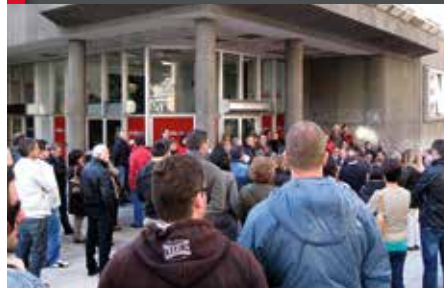
Concentración ante la sede de la Federación de Industria, en Oviedo.

Nuestras condolencias y un fuerte abrazo a los familiares y amigos de los fallecidos, así como a todos los compañeros de la minería de Castilla y León.