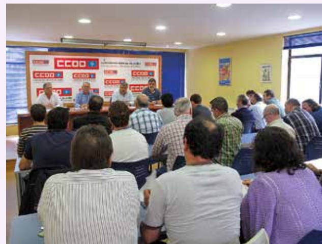
Asamblea auxiliares Avilés.

Cada dos meses, alternativamente en Gijón y Avilés, se celebrarán las reuniones de este órgano coordinador de las empresas auxiliares de ArcelorMittal en Asturias, demandado por todo el sector para facilitar la unidad de criterios a la hora de abordar la cualquier problemática que pueda surgir.