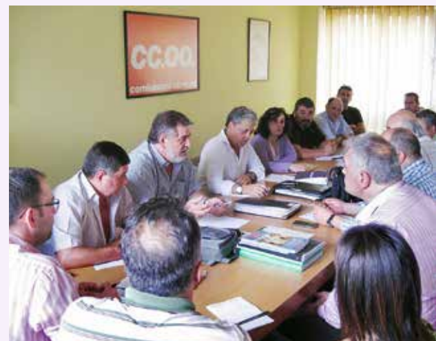
El nuevo órgano representa a unos 2.500 trabajadores.

Cada dos meses, alternativamente en Gijón y Avilés, se celebrarán las reuniones de este órgano coordinador de las empresas auxiliares de ArcelorMittal en Asturias, demandado por todo el sector para facilitar la unidad de criterios a la hora de abordar la cualquier problemática que pueda surgir.