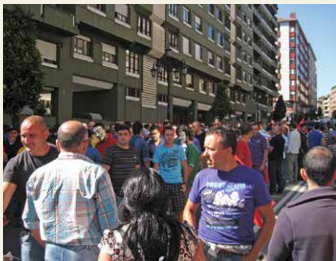
Concentración de trabajadores ante la sede de Hunosa, en Oviedo.

Por otra parte, la hullera anunció su intención de desprenderse de sus 14 economatos el 31 de diciembre vendiéndolos a empresas interesadas. Para la Federación de Industria de CCOO de Asturias es condición imprescindible para proceder a estudiar las posibilidades de venta que se garantice el mantenimiento del empleo mediante la subrogación de los 117 trabajadores que los economatos tienen en la actualidad.