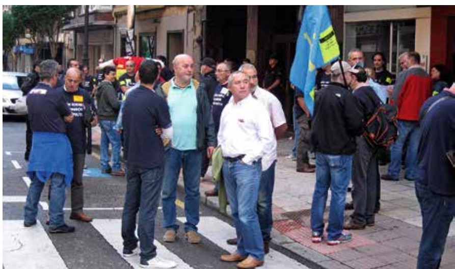
Concentración en Oviedo.

Los trabajadores están dispuestos a demostrar mediante una auditoría externa que la empresa está perfectamente adaptada para responder a las necesidades del mercado dentro de su sector. No se entiende pues la decisión de cerrar la planta y trasladar la producción a Rusia si no es por razones estrictamente mercantiles. La Federación de Industria de CCOO de Asturias denuncia que el Partido Popular es cómplice del desmantelamiento industrial, ya que su reforma laboral permite la deslocalización de grandes empresas sin apenas trámites y sin considerar el compromiso adquirido con los territorios.