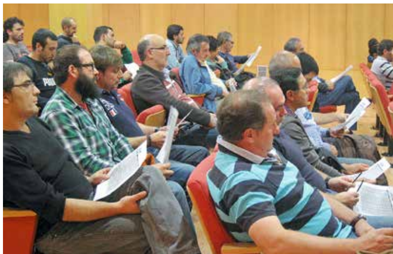
Asamblea del Metal en Avilés.

Para la Federación de Industria de CCOO de Asturias era fundamental lograr que el Convenio del Metal, que es referencia para el resto de sectores de la industria asturiana, recogiese los frutos del diálogo y la negociación colectiva, sin ceder a las presiones de la patronal. En todo el proceso cabe destacar el compromiso de la Comisión Negociadora de la Federación de Industria de CCOO de Asturias compuesta en su mayoría por delegados de la pequeña y mediana empresa que en todo momento supieron hacer frente a los planteamientos de Femetal. ■