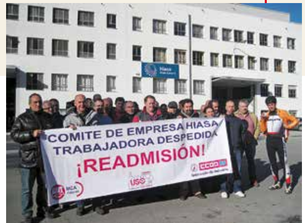
Los trabajadores de Hiasa, en apoyo a su compañera.

Pese a todo la dirección no ha readmitido a la trabajadora, con lo que se procederá a la vía judicial.