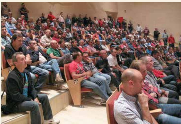
Asamblea de prejubilados de Hunosa en la Comarca del Caudal.

Nuestro próximo objetivo desde el Área de Minería y Energía es la consolidación de los años 2008-2009 en las tablas salariales con la actualización correspondiente hasta la fecha. Una reclamación que ya está en vía judicial.