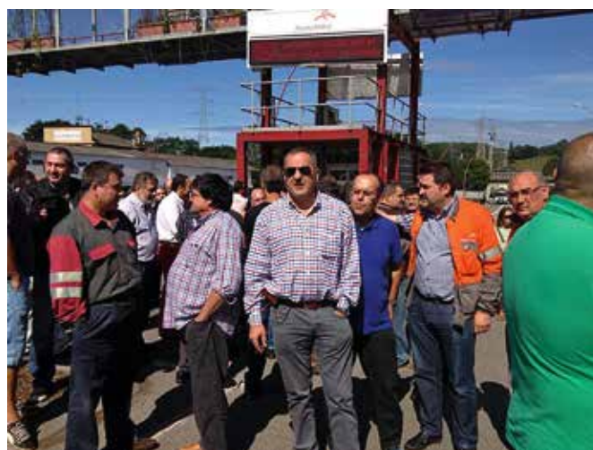
Concentración por accidente mortal en ArcelorMittal.