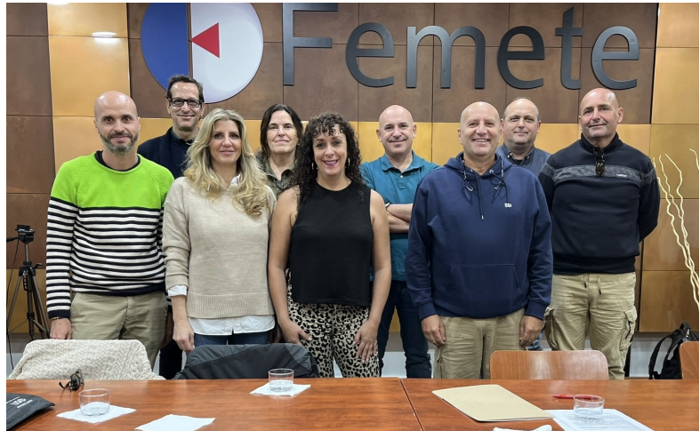
Miembros de la mesa negociadora del convenio del metal de Tenerife.

una vez que ha cobrado vigor la Tabla salarial II del 2023 con el 7,87% que marca la diferencia del 1% sobre la Tabla I del 2023, la cual tiene efecto retroactivo desde enero de 2023, este incremento del 5,27% para 2024 se aplica sobre dicha Tabla II del 2023.